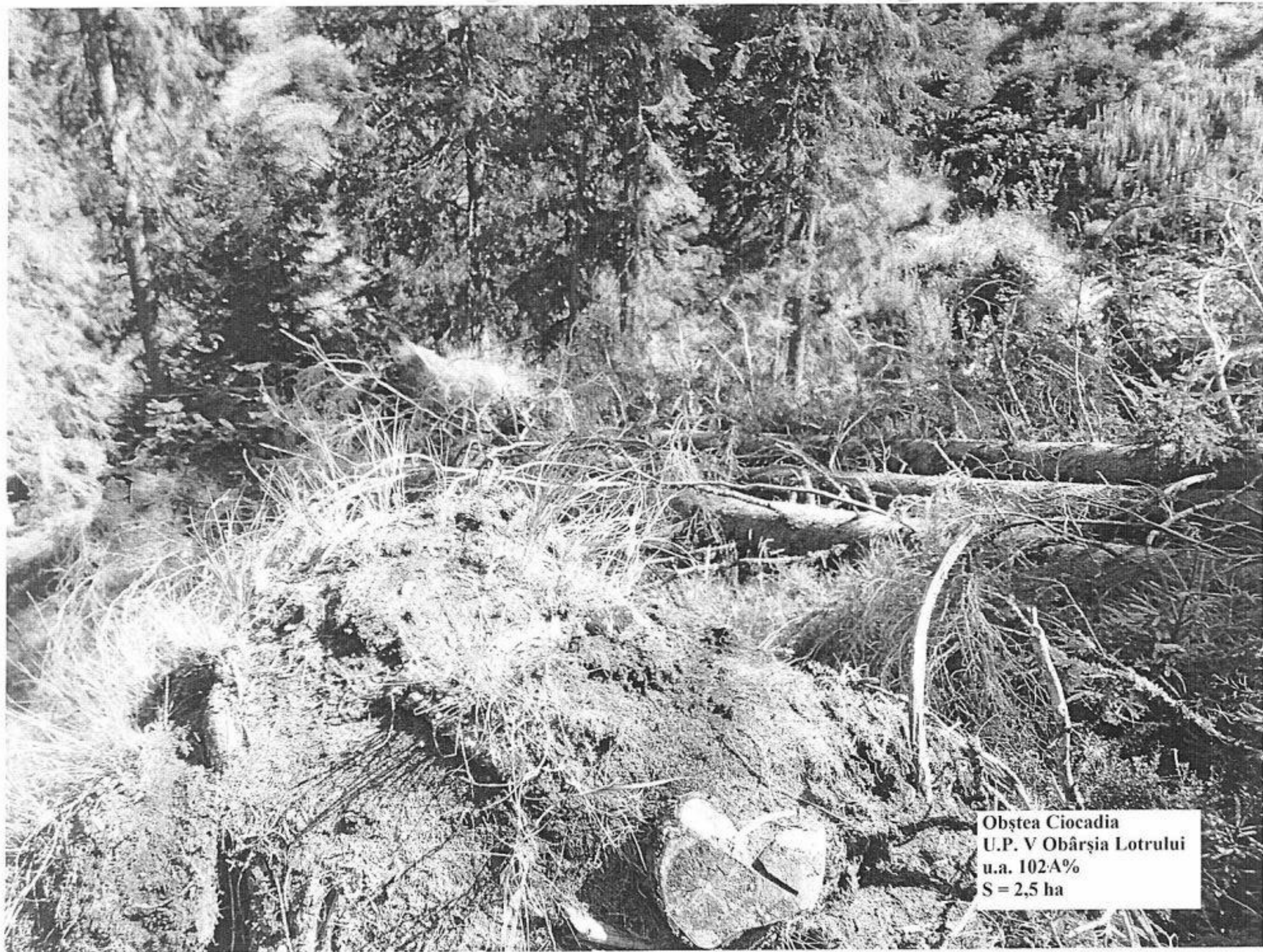
Obștea Ciocadia U.P. V Obârșia Lotrului u.a. 102A% S = 2,5 ha