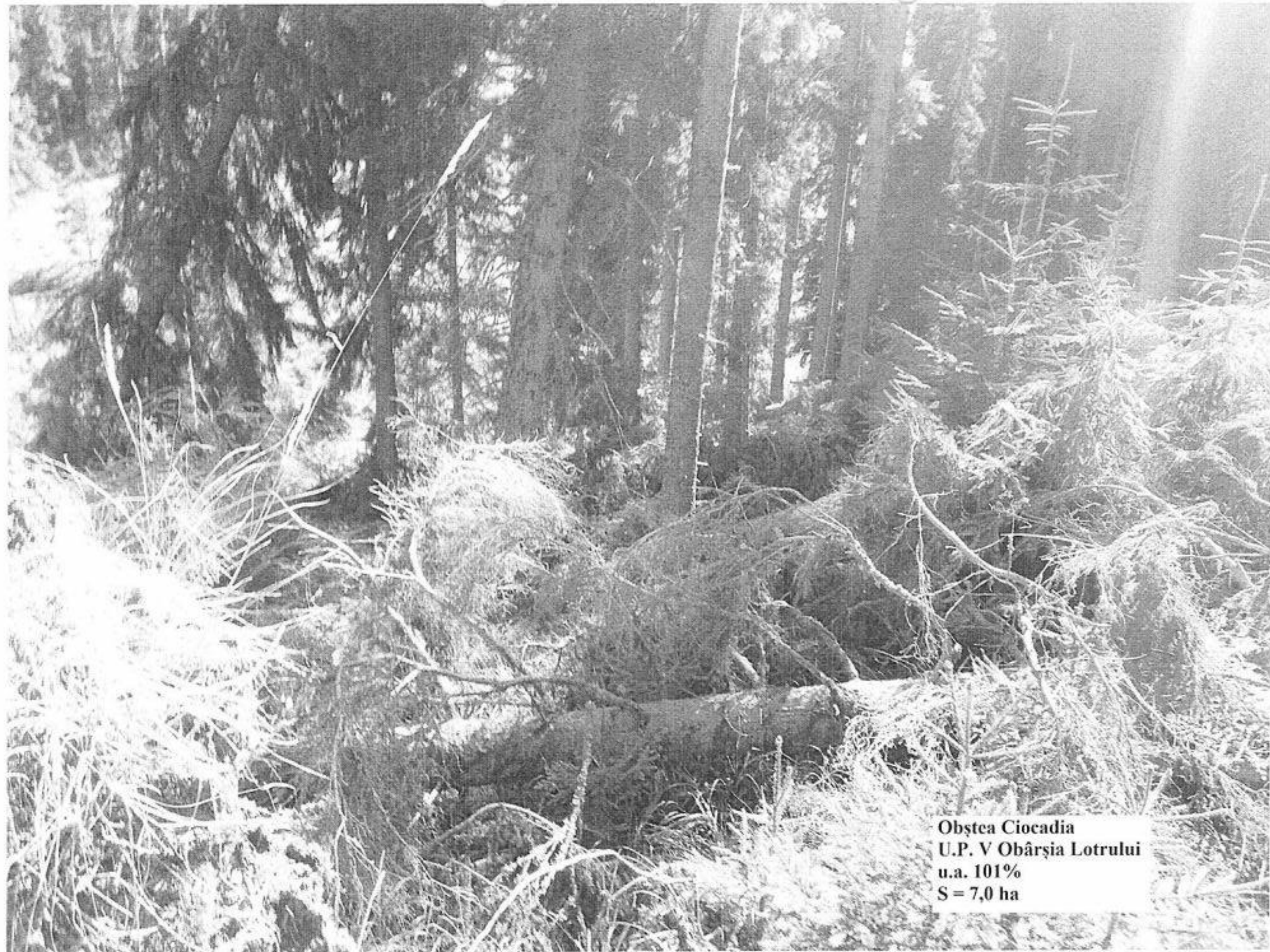
Obștea Ciocadia U.P. V Obârșia Lotrului u.a. 101% S = 7,0 ha