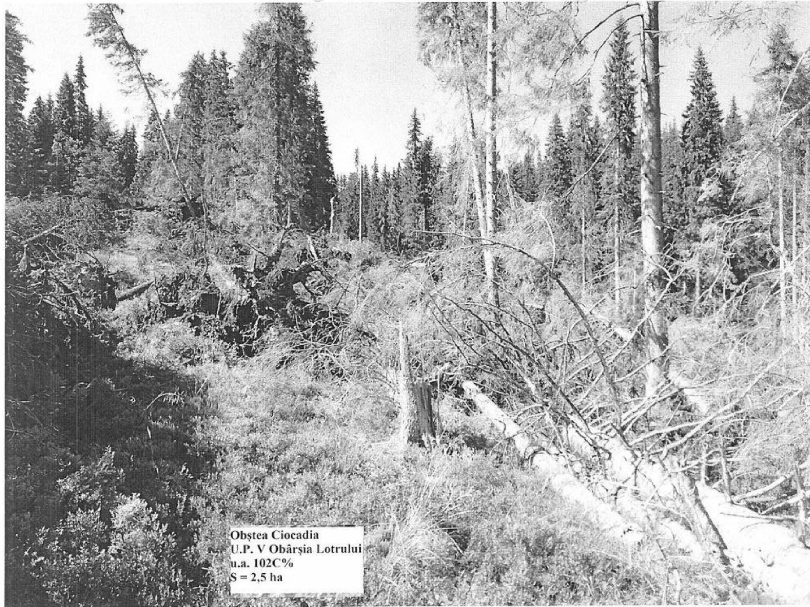
Obștea Ciocadia U.P. V Obârșia Lotrului u.a. 102C% S = 2,5 ha