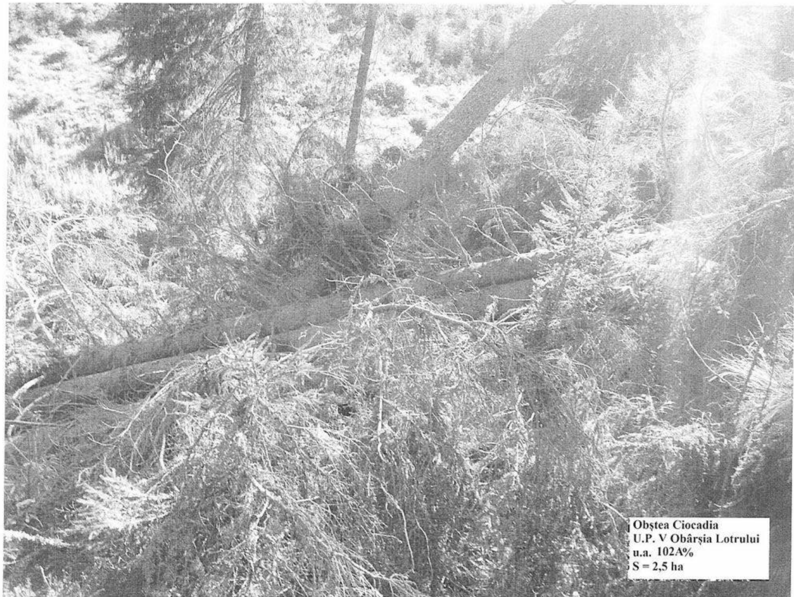
Obștea Ciocadia U.P. V Obârșia Lotrului u.a. 102A% S = 2,5 ha